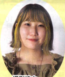
撮影協力 米満 桃花