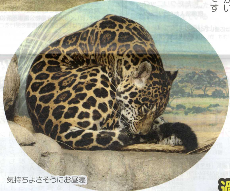
気持ちよさそうにお昼寝

ジャガーには天敵はいない! ジャガーは南北アメリカに住んでいます。名前の由来はアメリカ先住民の言葉「ヤガー」からきていて「突きで殺す者」という意味です。その意味の通り、前足の強力な攻撃で敵を倒します。見た目がよく似ているヒョウは、アフリカからユーラシア大陸にかけて生息していて、相手の首に噛みついて敵を倒します。