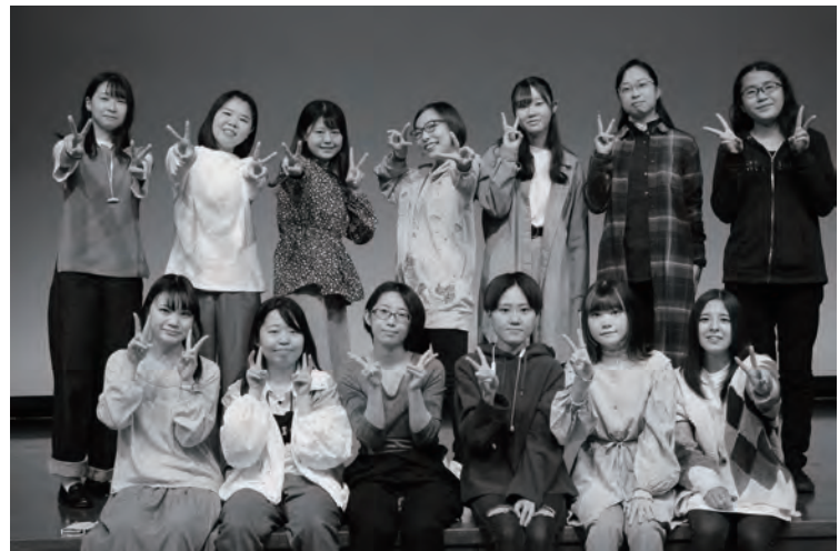
舞台芸術コース 舞台制作 2回生