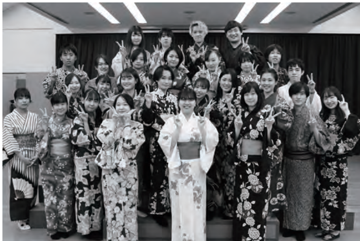
舞台芸術コース 身体表現 2回生