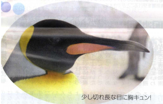
少し切れ長な目に胸キュン!

1羽は天王寺動物園生まれ、もう1羽は海遊館生まれ。生まれた環境が異なる2羽ですが、とつても仲良しなカップルです。エサを食べ終えた後、2羽でまつたりしている姿はほほえましく感じました。