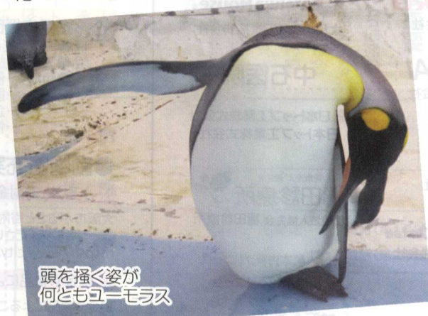
頭を揺る姿が何ともユルユル

動物の写真を撮るのは難しいですが、このアイドルペンギンの前ではカメラ初心者も安心。動きもゆったりしていてブレにくいので思い通りに撮れます。